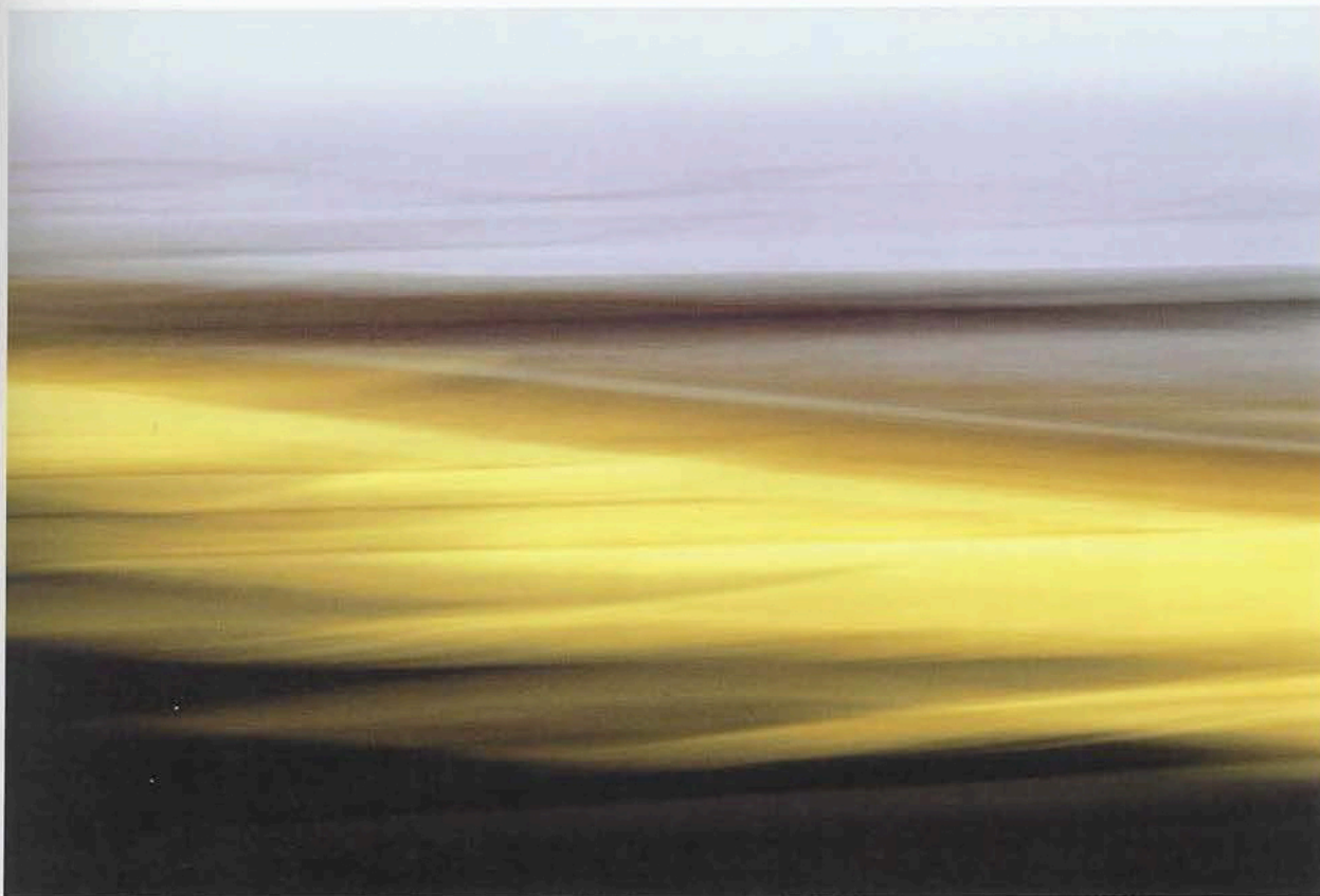
SOFT BELGIAN BEACH N° 1, 2003,